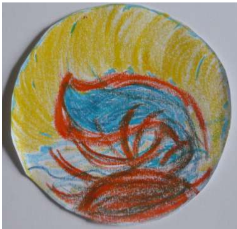
Mandala a mano libera - Tra luce, Spirito e fatica