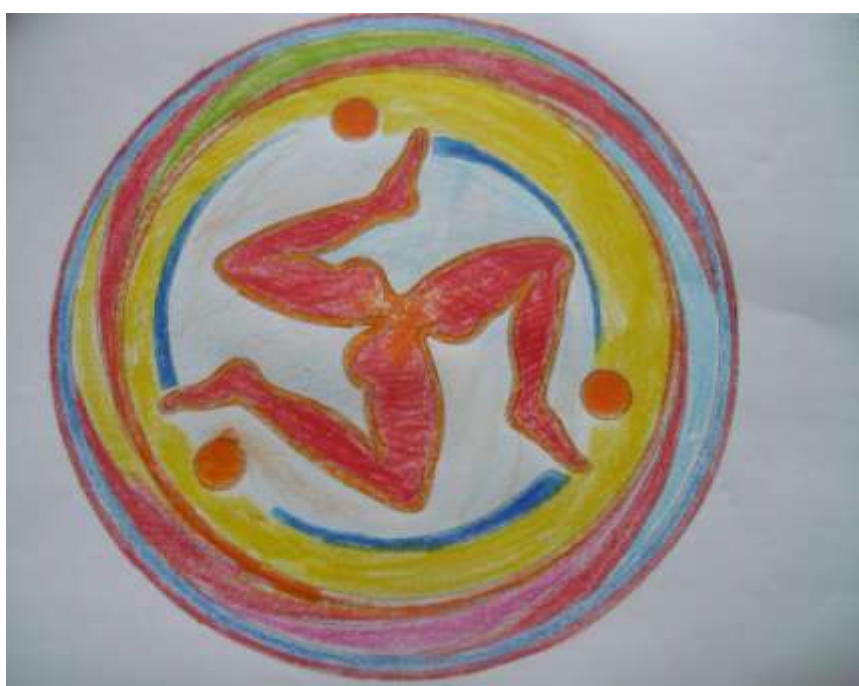
Mandala pre-disegnato DIVENIRE ATTIVI Consigli cromatici: rosso e arancione in abbinamento ad altri colori.