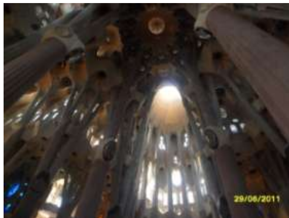
Interno Sagrada Familia

ritrovare la struttura a mandala nella stessa disposizione delle pietre. Nella cultura cristiana i mandala sono presenti nelle chiese attraverso i rosoni, presenti in particolar modo nella cattedrali gotiche, che rappresentano l'aspirazione alla totalità e all'ordine interiore con cui, contemplandoli, ci mettiamo in contatto. I rosoni diffondono e raccolgono la luce in modo tale che a volte, entrando in una cattedrale si ha l'impressione di essere entrati all'interno di un grande mandala. Recentemente ho avuto l'occasione di visitare la Sagrada Familia a Barcellona che, pur non essendo una cattedrale gotica, ha in sé un forte legame con la natura, con la sua ciclicità, con la ricerca di un centro spirituale dell'uomo; quando vi sono entrata ho avuto la precisa sensazione di essere entrata in un "cerchio sacro". La figura circolare è presente in tutta la costruzione ed in diverse espressioni, la luminosità presente all'interno, la grandiosità degli spazi ci fa percepire come rimpiccioliti rispetto alle normali dimensioni, come se stessimo camminando dentro la nostra spiritualità.