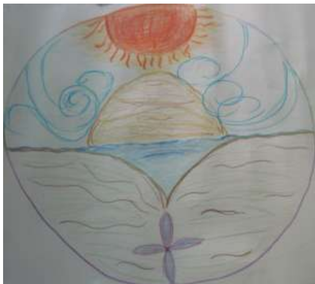
Mandala a mano libera - Il sale e il lievito in me

Propongo di seguito alcuni mandala realizzati con colori pastelli.