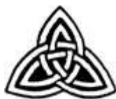
Il nodo di Tyrone

Rientrano nella simbologia dei mandala anche gli antichi intrecci dei nodi celtici . La cultura celtica suscita molto fascino e oggi spesso vengono riproposti i loro intrecci nella lavorazione dei gioielli. Gli intrecci possibili sono molteplici e seguire, con lo sguardo o con le dita, la loro struttura aiuta a raggiungere uno stato differente di coscienza. Il disegno dei nodi celtici nasce dalla suddivisione di poligoni regolari così da formare delle figure che ricordano appunto dei nodi. Lo studioso, J. Romilly Allen, “[...] ha dimostrato l’esistenza di otto tipi di intrecci, ognuno con un ritmo diverso, come una serie di movimenti musicali che tendono all’infinito, poiché, quando si chiudono in un cerchio o in un nodo, è impossibile trovarne l’inizio o la fine.” 4 La combinazione delle figure geometriche e dei nodi dà vita a molteplici tipologie di mandala celtici. Un esempio è il nodo di Tyrone, così chiamato perché inciso in una croce celtica in Irlanda vicino a Tyrone. Il suo significato riguarda la vita di una persona e il suo rapporto con l’amato. Inoltre racchiude in sé anche la simbologia del trifoglio che rappresenta la terra, l’acqua e l’aria. In generale la raffigurazione di un nodo celtico in un mandala indica il superamento di un conflitto o di una situazione problematica.