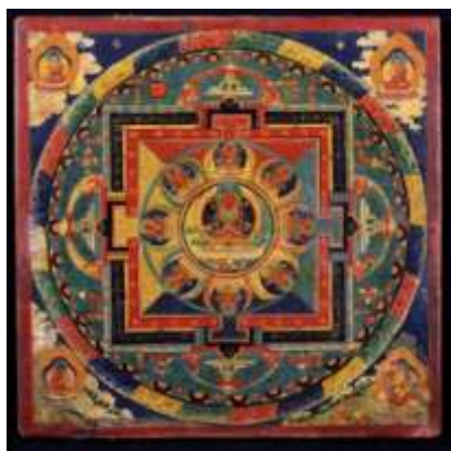
Mandala buddista tradizionale

L'equivalente del mandala in India è lo yantra , più schematico, usa figure geometriche e lettere in sanscrito, mentre sono assenti rappresentazioni di luoghi o persone come invece può avvenire nel mandala. Nella realizzazione di uno yantra partecipa anche il proprio corpo utilizzando posture yoga che promuovono la meditazione.