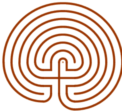
Labirinto celtico a forma circolare

Il labirinto celtico propone un'unica strada per arrivare al centro, rappresenta “un viaggio ideale nel ventre della Dea Madre” 6 e alla rinascita che avviene una volta usciti dal labirinto. Percorrere un labirinto significa arrivare al centro ma anche ripartire ricominciando dal centro. Il legame dei mandala con la figura femminile è quindi antichissimo. È l'immagine archetipica di Madre Natura che si trova dentro ognuno di noi, è il potenziale creativo, generante e materno di ogni individuo. Ripercorrere un labirinto che porta in sé questa dimensione può aiutare a mettere in contatto sé stessi con il proprio femminile , dimenticato o nascosto.