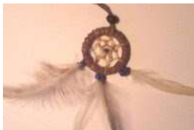
L'acchiappasogni degli Indiani d'America

indiani usano molti oggetti che accompagnano i passaggi della vita di una persona. Questi oggetti hanno forma e struttura tipica di un mandala, noto è l'acchiappasogni.