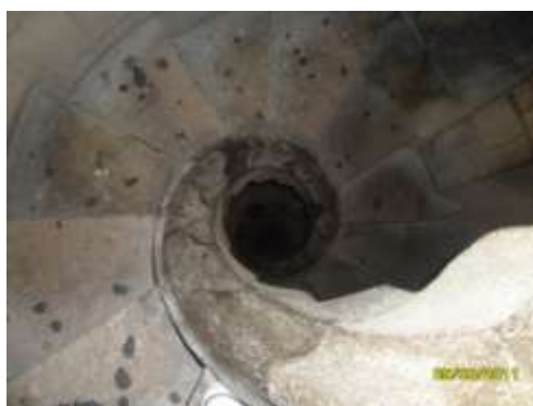
Sagrada Familia-Spirale in una scala a chiocciola della Torre della Passione

In alcune chiese si trovano impressi sul pavimento labirinti, che riportano il legame tra il mandala e il viaggio interiore che ognuno di noi può compiere per elevarsi